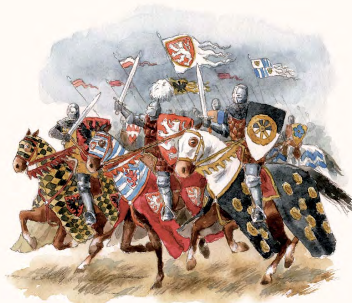
Slepý Jan Lucemburský v bitevní vřavě