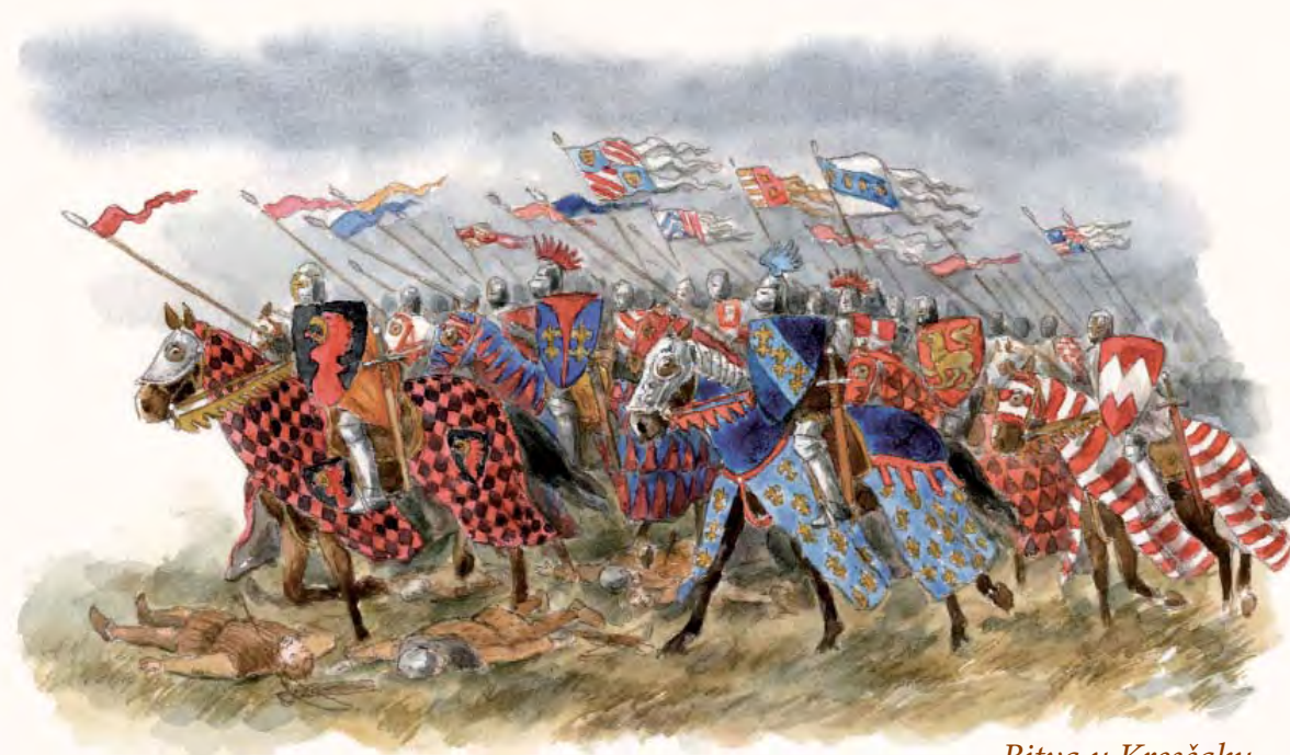
Bitva u Kresčaku

Ale sebejistí vůdcové předních šiků nečekali na povely a bez vědomí svého krále zbrkle zaútočili na nepřítele. „Na co čekat, vždyť jsme mnohem silnější, oproti nám jich je třikrát méně! Pobjijeme Angličany, než vyjdou první hvězdy. Do nich!“